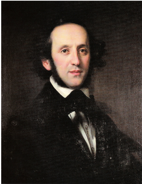
Felix Mendelssohn Bartholdy (1809–1847)